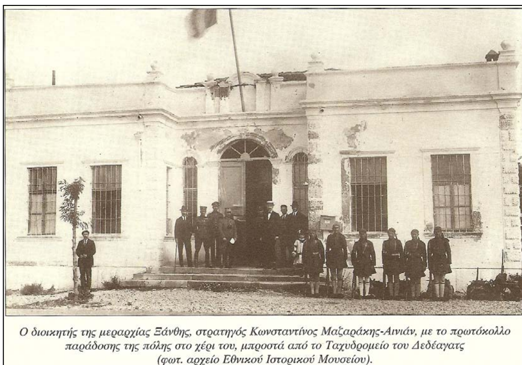
Ο διοικητής της μεραρχίας Ξάνθης, στρατηγός Κωνσταντίνος Μαζαράκης-Αινιάν, με το πρωτόκολλο παράδοσης της πόλης στο χέρι του, μπροστά από το Ταχυδρομείο του Δεδεάγατος (φωτ. αρχείο Εθνικού Ιστορικού Μουσείου).

Στα τέλη του 19 ου και στις αρχές του 20 ου αιώνα (1890 – 1910), στη πόλη λόγω του σιδηροδρόμου και του λιμανιού είχαν δημιουργηθεί όλες οι προϋποθέσεις για να κεντρίσει το ενδιαφέρον του Οθωμανικού Κράτους και να δημιουργήσει την κτιριακή υποδομή για μια σύγχρονη για την εποχή εκείνη πόλη. Την περίοδο αυτή κτίζονται πάρα πολλά κτίρια στη πόλη τόσο ιδιωτικά όσο και Δημόσια αλλά και κτίρια για τις διοικητικές και στρατιωτικές ανάγκες της Οθωμανικής διακυβέρνησης. Στον Γαλλικό οδηγό « ANNUAIRE ORIENTAL DU COMMERCE » του 1895 των R. Cervati και C. Freres αναφέρεται η ύπαρξη Ταχυδρομείου, Δικαστηρίου και άλλων Δημοσίων Υπηρεσιών.