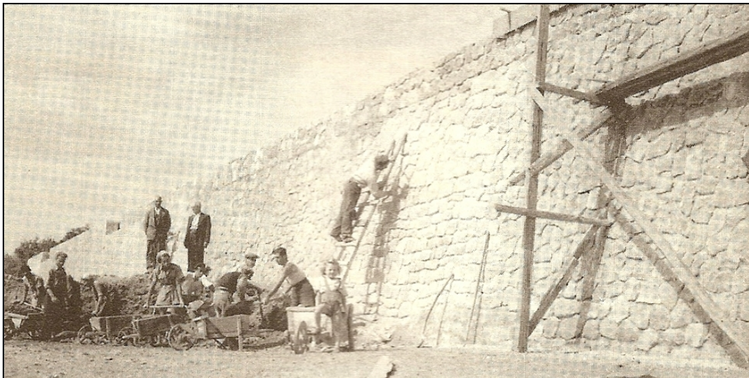
Το 1947 το Λιμενικό Ταμείο διέθεσε ποσό για να διαμορφωθεί το λιθόκτιστο πρανάς μεταξύ παραλιακού δρόμου και ακτής.